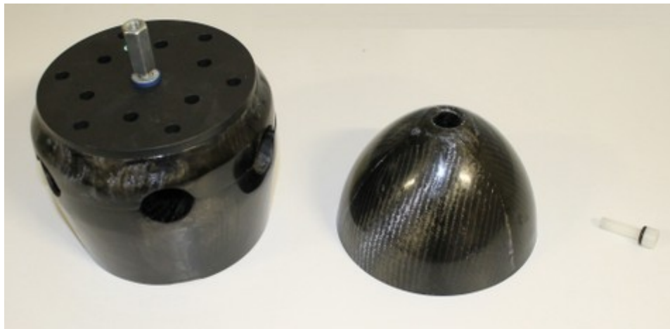
moyeu avec manchon hexagonal + rondelle Nord-Lock Mini-cône + vis Nylon avec son joint